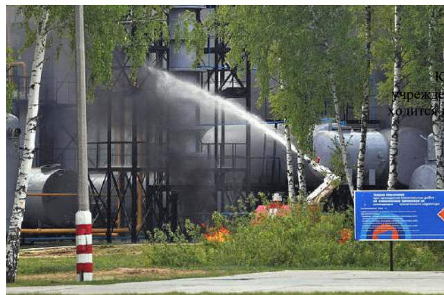
Краевое учреждение ДПО находится по адресу:

воздержаться от употребления водопроводной или колодезной воды, а также овощей и фруктов из огородов и садов до заключения специалистов об их безопасности.